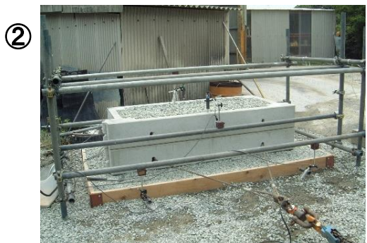
② 底なしブロック+碎石 (2段)