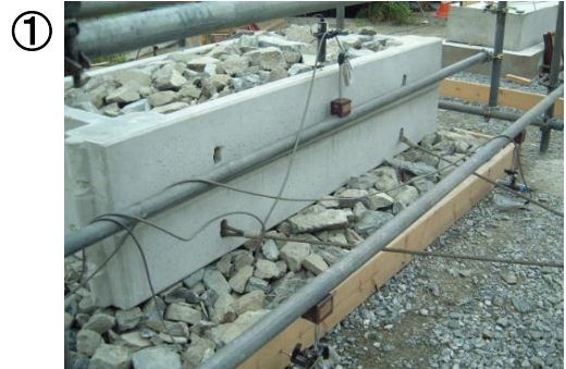
① 底なしブロック+栗石 (2段)