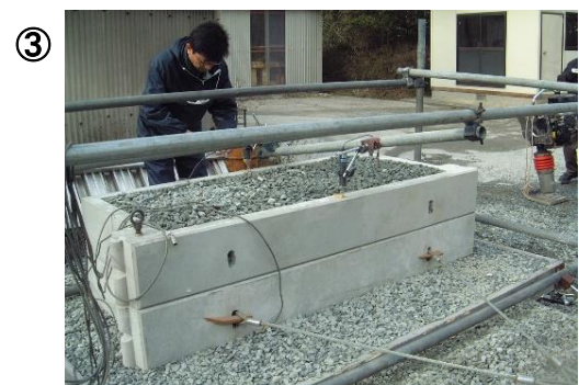
③ 底付きブロック+碎石 (2段)